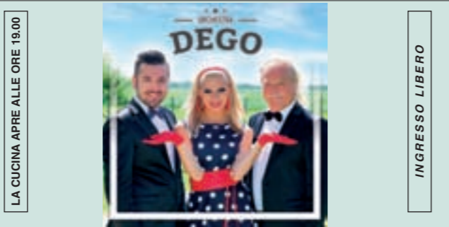
LA CUCINA APRE ALLE ORE 19.00 INGRESSO LIBERO SABATO 1 SETTEMBRE ORE 21.00 MUSICA DA BALLO LISCIO CON L'ORCHESTRA "DEGO"