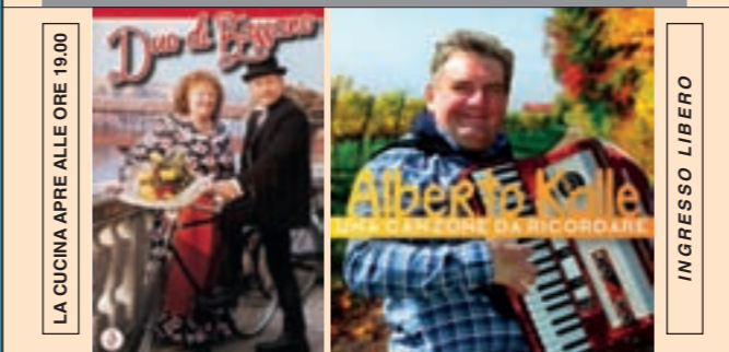
LA CUCINA APRE ALLE ORE 19.00 INGRESSO LIBERO LUNEDÌ 3 SETTEMBRE ORE 21.00 FOLK E CANTI POPOLARI CON IL "DUO BASSANO" E "UMBERTO KALLE"