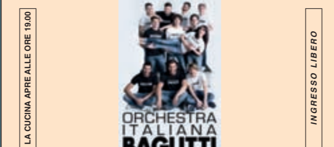
LA CUCINA APRE ALLE ORE 19.00 INGRESSO LIBERO MERCOLEDÌ 5 SETTEMBRE ORE 21.00 MUSICA DA BALLO CON L'ORCHESTRA "BAGUTTI"