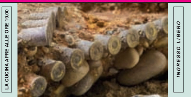
LA CUCINA APRE ALLE ORE 19.00 INGRESSO LIBERO VENERDÌ 31 AGOSTO ORE 20.30 INAUGURAZIONE DELLA MOSTRA DI REPERTI BELLICI NEL CENTENARIO DELLA GRANDE GUERRA

INFO: ENTE FESTE VARAGHESI TEL. 347 3607541 - FAX 0422 777117 - E-MAIL gjeffauna@libero.it