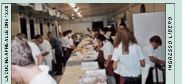
LA CUCINA APRE ALLE ORE 12.00 INGRESSO LIBERO DOMENICA 2 SETTEMBRE ALLE ORE 12.30 PRESSO IL TEATRO TENDA PRANZO DELLA COMUNITÀ - PER TUTTI