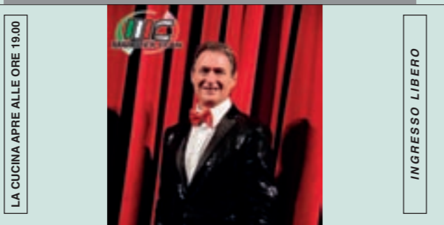
LA CUCINA APRE ALLE ORE 19.00 INGRESSO LIBERO VENERDÌ 31 AGOSTO ORE 21.00 MUSICA DA BALLO LISCIO CON L'ORCHESTRA "MARCO E CLAN"