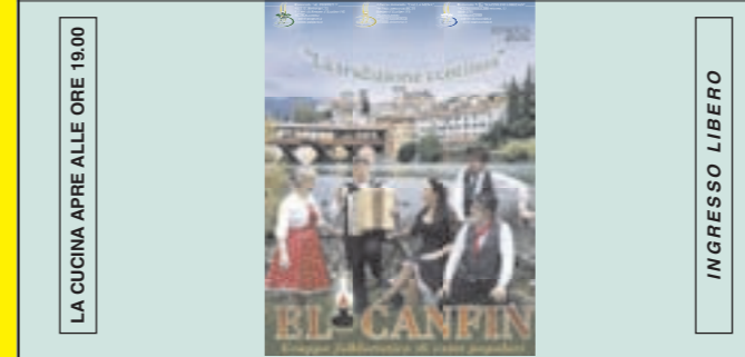
LA CUCINA APRE ALLE ORE 19.00 INGRESSO LIBERO SABATO 8 SETTEMBRE ORE 21.00 CONCERTO DI CANTI POPOLARI CON "EL CANFIN"