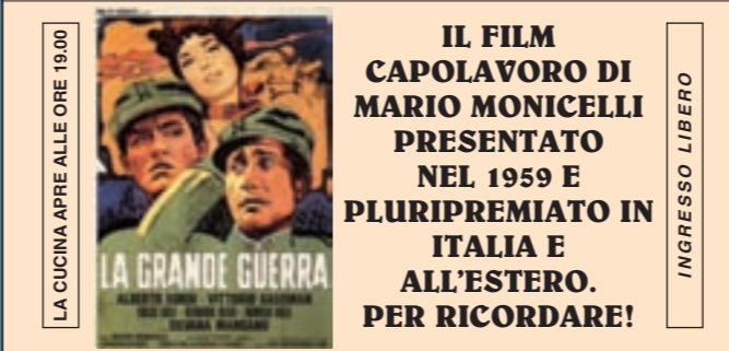
LA CUCINA APRE ALLE ORE 19.00 INGRESSO LIBERO MARTEDÌ 4 SETTEMBRE ORE 21.00 PROIEZIONE SU SCHERMO GIGANTE DEL GRANDE FILM "LA GRANDE GUERRA"