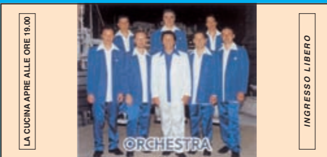
LA CUCINA APRE ALLE ORE 19.00 INGRESSO LIBERO DOMENICA 2 SETTEMBRE ORE 21.00 MUSICA DA BALLO LISCIO CON L'ORCHESTRA "RUGGERO SCANDIUZZI"