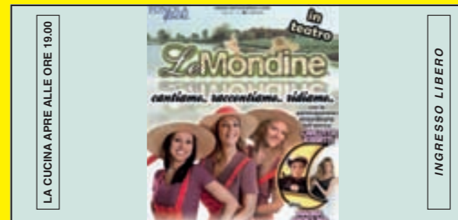
LA CUCINA APRE ALLE ORE 19.00 INGRESSO LIBERO GIOVEDÌ 6 SETTEMBRE ORE 21.00 CONCERTO DI CANTI POPOLARI CON "LE MONDINE"