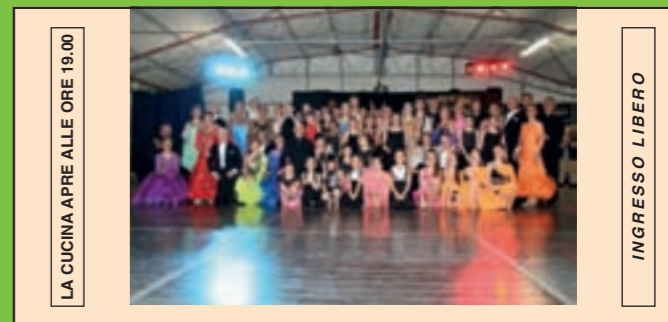
LA CUCINA APRE ALLE ORE 19.00 INGRESSO LIBERO DOMENICA 9 SETTEMBRE ORE 20.30 BALLETTI CON "THE MAGIC DANCE SHOW"